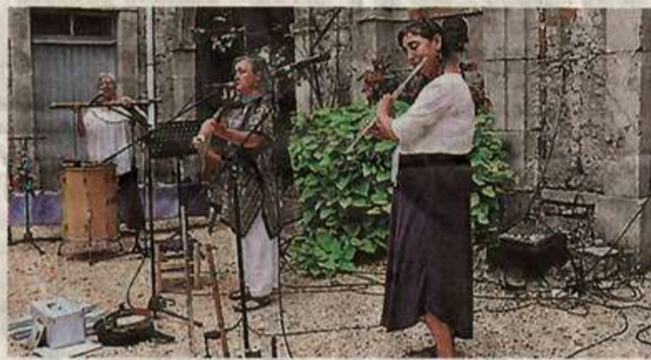
Trois musiciennes très complémentaires dans leur interprétation.

Même si personne ne s'est élançé sur une piste de danse improvisée, il suffisait de regarder les pieds des spectateurs