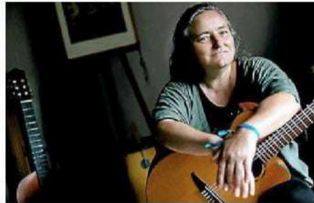
Un album consacrant, entre autres, les vertus du voyage.

Barbosa vient déposer au creux de son oreille. Un chant profond, « de paysan sans terre qui m'a marqué avec des textes de Chico Buarque », dont la jeune fille saisit intuitivement la dimension tragique, révoltée, artistique. Des sentiments irriguant ce nouvel EP constatant le quotidien « d'une vie où il faut continuer à y croire dans une forme de résilience. En tant qu'artiste, je me sens liée à la société dans laquelle je vis, un monde à l'aspect potentiellement chaotique qui cohabite avec quelque chose de merveilleux. » Soulignant la nécessité du voyage, des vertus de la rencontre à l'image de ces périples solitaires au Nordeste et la découverte des multiples courants irriguant l'histoire musicale de ce pays, « le Brésil à cette richesse d'avoir beaucoup ab-