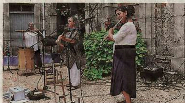
Trois musiciennes très complémentaires dans leur interprétation.

Même si personne ne s'est élané sur une piste de danse improvisée, il suffisait de regarder les pieds des spectateurs